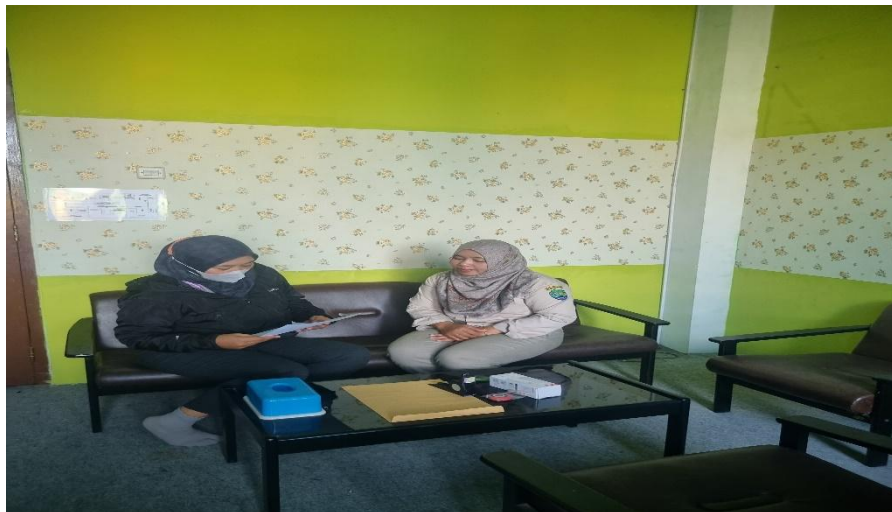
Gambar 1 melakukan perizinan

Tahap 1 ini yaitu melakukan perizinan kepada pihak Kader Posyandu Menur 3 untuk melakukan pengabdian masyarakat di posyandu tersebut, pertama menemui ketua kader, memperkenalkan diri, menjelaskan maksud dan tujuan untuk dilakukannya pengabdian di posyandu tersebut. Kedua melihat tempat untuk dilakukannya pengabdian ini dan menanyakan jumlah sasaran ibu balita yang dapat hadir saat kegiatan. Setelah dilakukannya penyampaian kegiatan yang akan dilakukan pihak kader posyandu mengizinkan untuk dilakukannya pengabdian masyarakat oleh mahasiswa Universitas Ngudi Waluyo. Berikut foto saat melakukan perizinan :