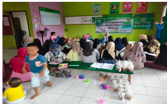
Gambar 1 Penyampaian Materi