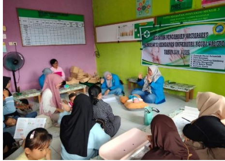
Gambar 2. peragaan pijat common cold (simulasi)