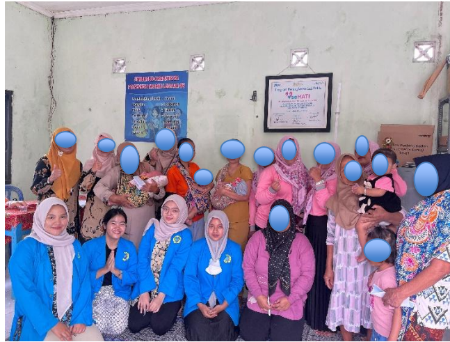
Gambar 1 Kegiatan Posyandu Desa Bogosari

berat badan, meningkatkan kualitas tidur, menambah kepadatan tulang, mempercepat perkembangan otak, dan membuat proses pencernaan menjadi optimal