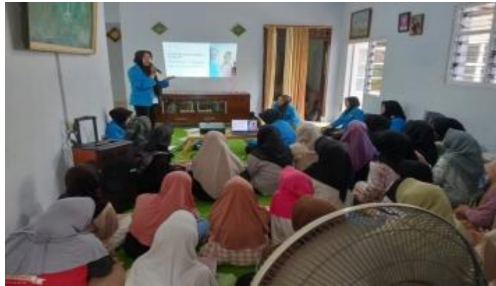
Gambar 1. Tahap Penyuluhan

Kegiatan pengabdian masyarakat ini dimulai dari tahap perencanaan meliputi pengajuan proposal, perbaikan proposal, pembuatan surat ijin kegiatan, melakukan kunjungan awal di lokasi tempat pengabdian masyarakat, melakukan pendataan jumlah remaja di desa Srinahan, Kesesi. Kemudian tahap pelaksanaan kegiatan pengabdian masyarakat yang meliputi tahap penyuluhan, tahap praktek, dan tahap evaluasi.