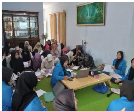
Gambar 2. Tahap Evaluasi

Pelaksanaan kegiatan pengabdian masyarakat yang telah diselesaikan, perlu untuk dilakukannya evaluasi yang bertujuan untuk menilai seberapa besar dampak yang dihasilkan dari proses pengabdian masyarakat. Evaluasi ini dilakukan dengan hasil pretest dan posttest peserta dengan menggunakan kuisioner pengetahuan tentang akupresur. Selanjutnya dilanjutkan dengan kegiatan pembuatan laporan pertanggungjawaban kegiatan.