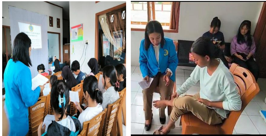
Gambar 3 evaluasi kegiatan