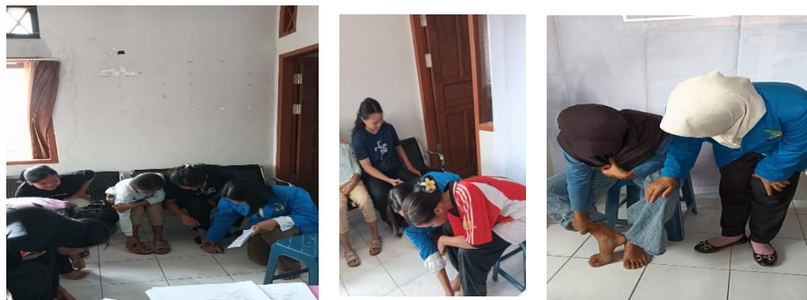
Gambar 2 demonstrasi akupresure

Setelah semua materi telah disampaikan oleh pemateri dilanjutkan dengan praktek tehnik akupresure untuk mengurangi dismenore. Praktek tehnik akupresure dilakukan dengan beberapa remaja untuk maju kedepan untuk melakukan demonstrasi secara langsung tehnik akupresure yang benar dan diikuti dengan remaja lainnya untuk mengikuti gerakan akupresure.