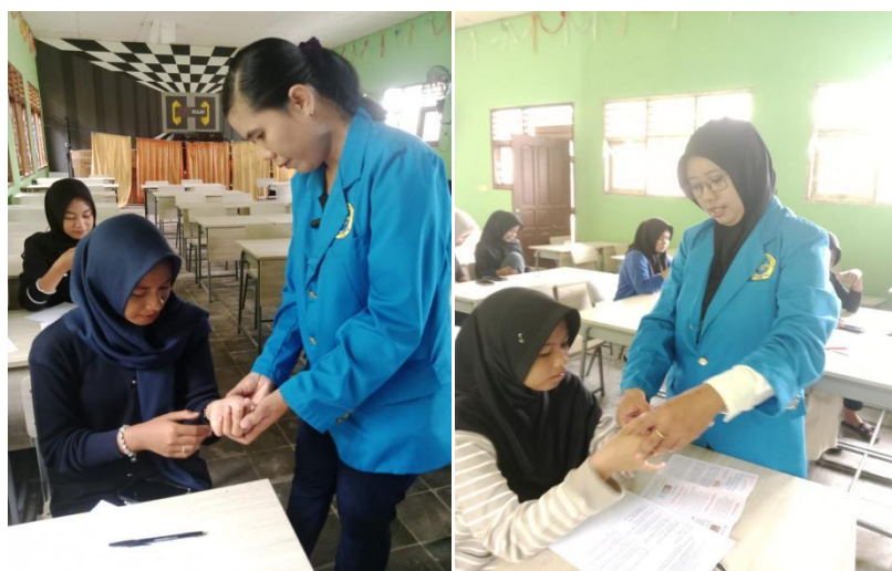
Gambar 2 demonstrasi akupresure

Setelah semua materi telah disampaikan oleh pemateri dilanjutkan dengan praktek tehnik akupresure untuk mengurangi dismenore. Praktek tehnik akupresure dilakukan dengan beberapa remaja untuk maju kedepan untuk melakukan demonstrasi secara langsung tehnik akupresure yang benar dan diikuti dengan remaja lainnya untuk mengikuti gerakan akupresure.