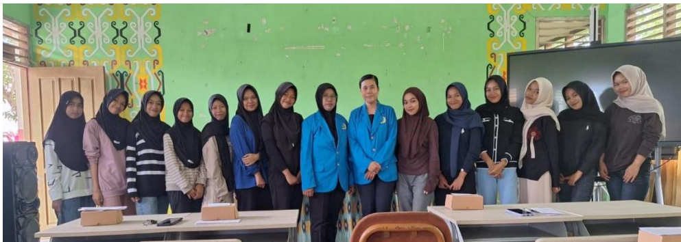
Gambar 3 evaluasi kegiatan