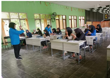
Gambar 1 Penyampaian Materi Penanganan Akupresur Dismenore

Tahap ini dimulai dari paparan tentang pengertian dismenore, macam-macam dismenore dan tanda gejala dismenore (Larasati, T. A. & Alatas, 2016) serta penanganan dismenore yang dapat dilakukan secara farmakologi dan non farmakologi. Terapi farmakologi antara lain yaitu pemberian obat analgesik, terapi hormonal, obat nonsteroid prostaglandin, dan dilatasi kanalis servikalis (Prawirohardjo, 2009). Sedangkan terapi non farmakologi melalui distraksi, relaksasi, imajinasi terbimbing, kompres hangat atau dingin, dan menggunakan akupresure atau penekanan pada titik- titik tertentu untuk mengurangi nyeri haid. Setelah pemaparan mengenai dismenore dilanjutkan dengan materi tehnik akupresure untuk mengurangi dismenore yang terdiri dari 4 titik penekanan. Sebelumnya menyampaikan secara singkat metode akupresure adalah pengobatan cina (tiongkok) yang sudah dikenal sejak ribuan tahun lalu dan dengan memberikan tekanan atau pemijatan dan menstimulasi titik-titik tertentu dalam tubuh. Pada dasarnya terapi akupresur merupakan pengembangan dari teknik akupuntur, tetapimedia yang digunakan bukan jarum, tetapi jari tangan atau benda tumpul (Ali, 2005). setelah penyampaian mengenai pengertian akupresure dilanjutkan dengan titik-titik penekanan akupresure untuk mengurangi dismenore antara lain Titik SP6 (Chen & Chen, 2004), titik Hoku/He-qu (LI4) (Mahoney, 1993), titik gabungan antara Taichong (LR3) dan Neiguan (PC6) (Julianti, 2011) materi disampaikan oleh Poulina Lallo Amd. Keb.